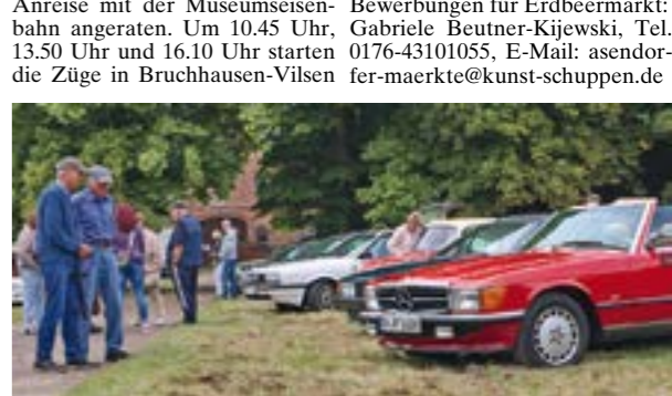
„Oldie but Goldie“ heißt es beim Oldtimer-Treff