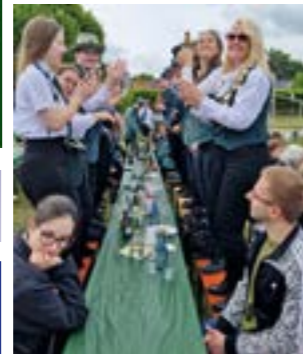
Ausgelassene Stimmung beim Katerfrühstück 2025

HASSEL. Ab Himmelfahrt geht es wieder rund in Hassel und es wird Schützenfest gefeiert – diesmal mit neuem Konzept: Die Schützenscheiben werden bereits am Samstag verteilt und direkt nach dem Ausbringen findet der Schützenball statt. Am Sonntag wird ein buntes Rahmenprogramm für die ganze Familie Gemeinde- und Preisscheibe. Auf dem Zeltplatz sorgt DJ Uwe Eggers ab 12 Uhr für musikalische Stimmung. Ab 14.30 Uhr wird mit Spannung die Proklamation des neuen Kaisers, Schützen- Jugend- und Kinderkönigs erwartet. Ab 18 Uhr steigt die Zeltparty mit dem TNT Team. Nach dem Ruhetag am Freitag beginnt das Fest am Samstag, den 16. Mai um 16.20 Uhr mit dem Antreten zum Ummarsch durch das Dorf zur Befestigung der Königsscheiben unter Begleitung des Spielmannzugs Rethem. Ab 20 Uhr findet der große Festball mit der Band „Happy End“ statt. Während des Abends erfolgt die Proklamation des Gemeindegö-