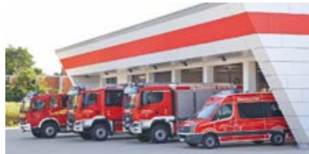
Das neue Feuerwehrgerätehaus in Eystrup.

EYSTRUP. Am 9. Mai 2026 lädt die Eystruper Feuerwehr zu einem Tag der offenen Tür im neuen Feuerwehrgerätehaus, an der Feuerwehr 1, ein. Von 10 bis 17 Uhr können alle Interessierten das neue Domizil der Eystruper Feuerwehr sowie die neuen Fahrzeuge in Augenschein nehmen. Weitere Einheiten aus der Samtgemeinde und dem Landkreis werden ebenso präsent sein. Eine Drehleiter der Stadt Nienburg, der neue Rüstwagen aus Stolzenau, das Feuerwehrboot des Nordkreises, die Einsatzleitung Ort (ELO) sowie die Höhenrettungsgruppe aus Wienbergen und die Hygienegruppe Hämelhausen bieten den Besuchern einen Einblick in das breite Einsatzspektrum der freiwilligen Feuerwehr.