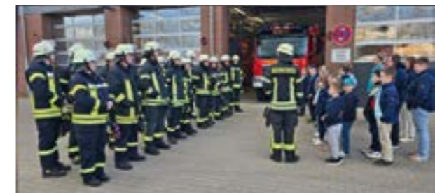
Die Kinder waren beim aktiven Feuerwehrdienst dabei

HOYA. Die Kinderfeuerwehr Hoya durfte vor kurzem eine Nacht im Feuerwehrhaus verbringen. Nachdem alle ihre Betten aufgebaut hatten, erfolgte ein gemeinsames Abendessen mit Bratwurst und Pommes. Die Kinder und Betreuer nahmen dann am Abend bei dem aktiven Dienst der Feuerwehr Hoya teil. Alle Kinder durften mit dem Strahlrohr ein Feuer löschen, ein Atemschutzgerät aufsetzen, an einer Höhenrettung teilnehmen und sich in einer Schleifkorbtrage in die Höhe ziehen lassen und viele weitere spannende Sachen. Die Kinder waren begeistert. Als Dankeschön gab es für die Feuerwehrleute Bratwurst von der Kinderfeuerwehr. Nach einer ruhigen Nacht starteten alle mit einem gemeinsamen Frühstück. Zum Abschluss stand noch ein Besuch auf dem Spielplatz und bei der Ortsbrandmeisterin an, bevor alle Kinder von den Eltern abgeholt wurden.