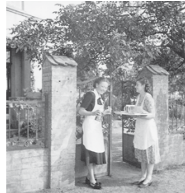
... vor vielen Jahren.