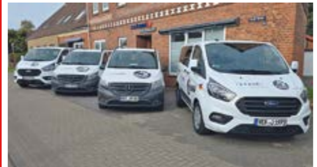
Die zu vermietenden Fahrzeuge stehen an der Großen Straße 29 in Dörverden bereit: QR-Code scannen, Türen auf, los geht's: standby-Geschäftsführer Jörg Müller macht's vor.

DÖRVERDEN. In Dörverden startet ein besonderes Mobilitätsangebot: Die standby-Profis GmbH bringt mit vier Bussen zur Personenbeförderung ein eigenes Carsharing-Angebot an den Start, das man durchaus VAN-Sharing nennen darf – ideal für Familienausflüge, Mannschaftsfahrten und Vereinsaktivitäten. Die Fahrzeuge stehen an der Großen Str. 29 bereit; perspektivisch werden die Busse auch in Verden, in Bahnhofsnähe, platziert. Gebucht wird bequem digital über die MOOO-App – wahlweise schon von zu Hause oder