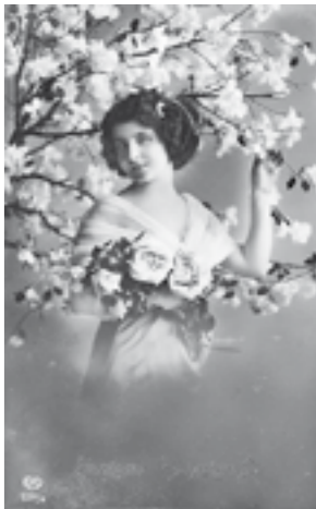
... vergangener Tage.

Genieße den Tag – denn jeder ist ein Geschenk!