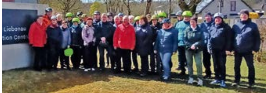
Die Radgruppe vor der Gedenk- und Bildungsstätte „Alte Pulverfabrik“ in Liebenau