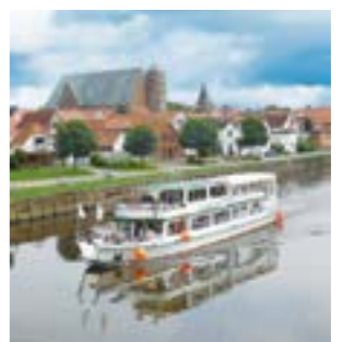
Die Flotte Mittelweser bietet auf dem Fahrgastschiff „Stadt Verden“ vielfältige Fahrten an

Spargelfahrten Im Mai finden wieder die beliebten Spargelfahrten statt. An Bord erwartet die Gäste ein Spargelbuffet zum Sattessen mit allem, was der Spargelfan begehrt: Spargel satt, Schinkenplatte, Salzkartoffeln, Schnitzel, Rührei, Sauce Hollandaise und Buttersauce. Die Spargelfahrten starten um 11 Uhr und finden an folgenden Terminen statt: Montag, 11. Mai; Mittwoch, 13. Mai; Sonntag, 17. Mai und Mittwoch, 20. Mai. Das Fahrgastschiff „Stadt Verden“ bietet auch im Mai wieder die Aller-Weser-Rundfahrten