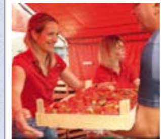
Leckere, saftige Erdbeeren soweit das Auge reicht

Außerdem präsentieren rund 60 Ausstellende Kunsthandwerkliches wie z. B. Schmuck, Handgenähtes, Deko für Haus und Garten, Holzkunst, Kindermode oder Gehäkkeltes, aber auch Lebensmittel wie Gewürze, Feinkost, Brot, Käse, Wurst, Fisch, frisches Obst und Gemüse und vieles mehr gehören zum Angebot. Der Kunst-Schuppen bietet viele Stände mit Kunsthandwerk wie Stein- und Keramikguss-Figuren für Garten und Haus, Schnitz- und Kettensägen-Werke, Seife, Schmuck und vieles mehr im Inneren und im Außenbereich. Kinder und Jugendliche erwartet Kinderschminken, eine Hüpfburg vor dem Modehaus Siemers und ein Kinderkarussell am Lockschuppen.