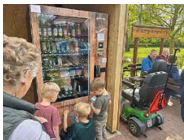
Mit dem neuen Getränkeautomaten sind die Wienberger in die Freiluftsaison gestartet – ob groß oder klein, jeder ist herzlich willkommen.