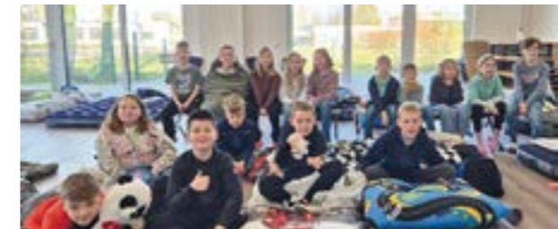
Eine Nacht im Feuerwehrhaus verbrachten die Kinder