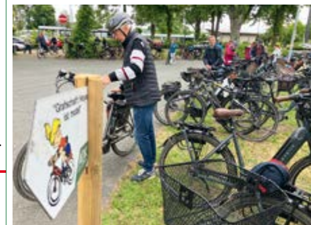
Die Schilder auf der Fahrradrallye zeigen die Richtung im Uhrzeigersinn an

Fahrrad und der Personalausweis. Die Kostenbeteiligung beträgt 10 Euro, mit Akku 12 Euro. Für ADFC-Mitglieder fallen keine Kosten an. Eine Anmeldung ist nicht notwendig. Als Kennung für die Codierung nutzt der ADFC eine bundeseinheitliche Datenbank unter Verwendung von Schlüsselnummern der Gemeinden. Das System der EIN-Codierung (Eigentümer-Identifizierungs-Nummer) wurde von der Polizei Friedberg entwickelt und von den Innenministern der Länder 1997 gebilligt. Die Methode erlaubt eine einfache Zuordnung von aufgefundenen Fahrrädern zu den Adressen ihrer Eigentümer. Codiert wird per Klebecodierung, sodass auch Fahrräder mit Carbonrahmen gekennzeichnet werden können.