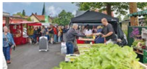
Viele Stände bieten die unterschiedlichsten Waren an

ASENDORF. Der 26. Erdbeermarkt der IGA mit verkaufsoffenem Sonntag präsentiert sich mit seinem bekannt umfangreichen Angebot an liebevoll dekorierten Ständen zum Anschauen, Kaufen, Informieren und Schlemmen vom Kunst-Schuppen bis zum (ab 13 Uhr auch geöffneten) Modehaus Siemers zwischen 11.00 und 18.00 Uhr. Neben frischen Erdbeeren und ihren vielfältigen schmackhaften Verarbeitungsformen gibt es wieder eine große Palette herzhafter und süßer Imbiss-Spezialitäten an vielen Stellen über den Markt verteilt.