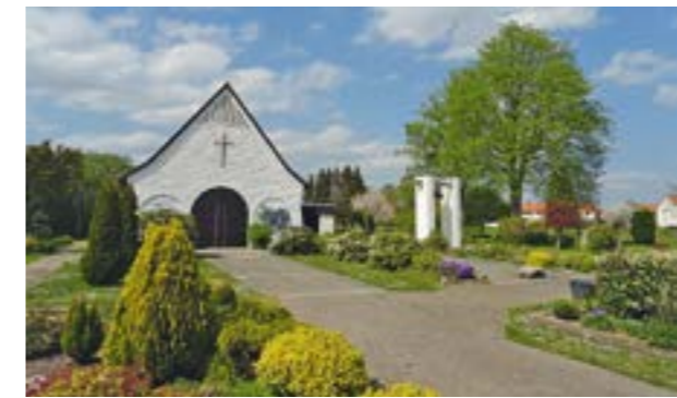
Die Kapelle auf dem Friedhof in Hoya

HOYA. Am Sonntag, den 21. Juni 2026, verwandelt sich der Friedhof in Hoya von 11 Uhr bis 16 Uhr in einen Ort der Begegnung, Information und Inspiration. Unter dem Motto „Friedhof mal anders“ erwartet Besucherinnen und Besucher ein vielfältiges Programm für Jung und Alt. Zahlreiche Ausstellungen und Infostände bieten Einblicke in Themen rund um Abschied, Erinnerungskultur und Vorsorge. Fachkundige Beratung ist direkt vor Ort möglich – eine Gelegenheit, sich in ruhiger Atmosphäre umfassend zu informieren. Ein abwechslungsreiches Rah-