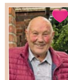
Lieber Friedel, Papa, Opa, Uropa.

Nagelschmiede 10 · 27283 Verden/Aller · Telefon 04231-82117 info@herrenfriseur-verden.de · www.herrenfriseur-verden.de