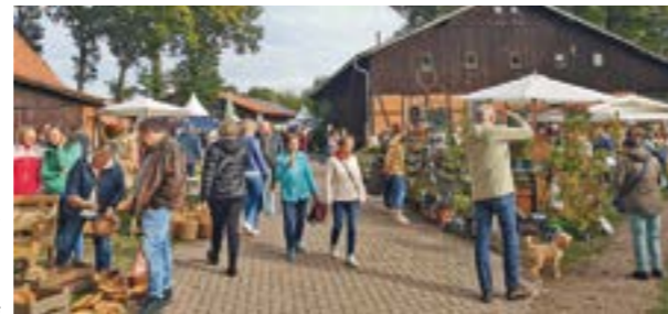
In entspannter Atmosphäre auf dem Beekenhof flanieren ...