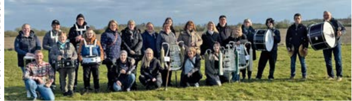
Der Spielmannzug Hülßen begleitet den Ummarsch durch das Dorf.

Ab 19 Uhr beginnt der Königssball, der für jedermann offen ist. „DJ Basti“ übernimmt wie bereits in den letzten Jahren die musikalische Unterstützung und wird für gute Stimmung unter den Gästen sorgen. Party-Spaß ist