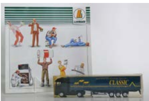
Exponate der Firma Lühmann: Prospekt aus den 1980er Jahren sowie ein Modell-Laster

HOYA. Seit Anfang März läuft im Heimatmuseum Grafschaft Hoya die Sonderausstellung „Wirtschaftsleben made in Hoya“. Nun wechselt erstmals die begleitende Gastausstellung. Bis Ende April war die Präsentation des Verbundes „Lebe Deine Ausbildung“ zu sehen. Bis 14. Juni 2026 ist aktuell die Lühmann Gruppe mit der Ausstellung „Lühmann-Tankstellen aus Hoya“ zu Gast. Dabei geht es um die Entwicklung dieses Betriebszweiges des Hoyaer Unternehmens, begonnen bei der kleinen Tankstelle direkt auf dem Betriebsgelände hin zu einem Tankstellennetzwerk mit bis zu über 200 Tankstellen in ganz Deutschland. Die Hauptausstellung, die bis zum nächsten Jahr zu sehen ist, verfolgt die Entwicklung Hoyas von dem landwirtschaftlich geprägten Ort bis hin zum heutigen Industriestandort. Ein Blick in die Innenstadt führt das einst vielfältige Geschäftsleben der 1950er und 1960er Jahre vor Augen. Zahlreiche Exponate stehen für die Geschäfte und Firmen, die das Wirtschaftsleben Hoyas in Vergangenheit und Gegenwart ausmachen. Die Ausstellung bleibt aber nicht nur in Hoya, sondern sie zeigt auch, mit welchen Produkten die Stadt