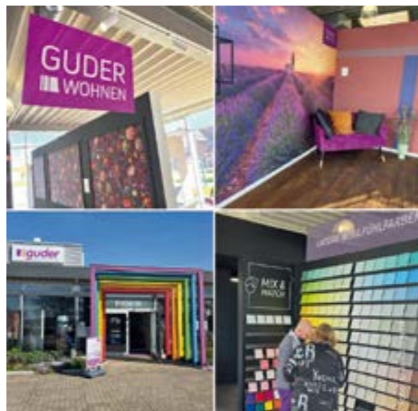
Das neue Musterstudio der Guder GmbH begeisterte beim Tag der offenen Tür im April

HOYA. Bei strahlendem Sonnenschein öffnete die Guder GmbH die Türen ihres neuen Musterstudios – und der Zuspruch ließ keine Wünsche offen. Zahlreiche Besucher aus der Region nutzten die Gelegenheit, die modernen Räumlichkeiten in Augenschein zu nehmen, sich inspirieren zu lassen und direkt mit den Experten vor Ort ins Gespräch zu kommen. Die Atmosphäre war von Anfang an herzlich und lebendig, das Interesse der Gäste spürbar groß.