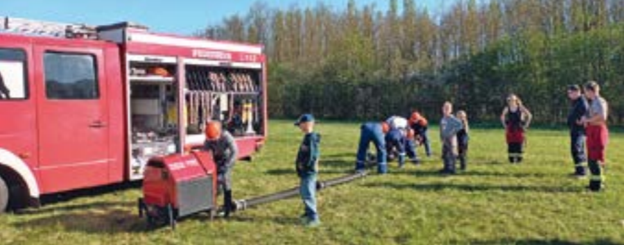
Die jungen Brandschützer waren mit Eifer dabei

WAHNEBERGEN. Ein abwechslungsreiches Programm erwartet die Mitglieder der Kinderfeuerwehr Wahnebergen auch in diesem Jahr. Das Betreuungsteam hat einen vielfältigen Dienstplan zusammengestellt, der neben Spiel und Kreativität auch spannende Einblicke in die Welt der Blaulichtorganisationen bietet. Nach dem traditionellen Auftakt mit einem „Kinodienst“ im Gerätehaus, Osterbasteln und einer Bilderrallye standen zuletzt besondere Programmpunkte im Mittelpunkt. So besuchten die jungen Brandschützer die Polizei in Verden. Dort erhielten sie einen anschaulichen Einblick in den Alltag der Beamten, besichtigten die Wache samt Ausrü-