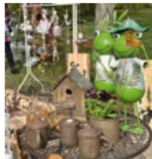
Jede Menge Dekoratives gehört zum Angebot ...

Der Beekenhof in Bommelsen, gelegen zwischen Soltau und Walsrode, öffnet vom 8. bis 10. Mai 2026 täglich von 10 bis 18 Uhr seine Tore (letzter Einlass 17 Uhr). Der Eintritt beträgt fünf Euro für Erwachsene, während Kinder bis 16 Jahre sowie Oldtimerfahrer (mit H-Kennzeichen) freien Eintritt erhalten. Kostenlose Naturparkplätze stehen rund um das Gelände zur Verfügung. Hunde sind an der Leine willkommen. Veranstaltungsinformationen gibt es auch bei Facebook und Instagram (Beekenhof Veranstaltungen).