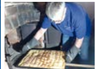
Das Backblech wird gerade aus dem Ofen gezogen.

HÜLSEN. Die Backtage in Hülßen sind inzwischen ein Highlight im Sommer – nicht nur für die Einheimischen, sondern auch für Radtouristen und -touristinnen, die ihre Pausen gerne unter den Eichen einlegen und sie mit Kuchen versüßen. Der Andrang im letzten Jahr war so groß, dass der Kulturförderkreis weitere Backbleche angeschafft hat, um mehr von dem köstlichen Kuchen herstellen zu können. Am 17. Mai duftet es wieder unter den Eichen bei den Schafställen in Hülßen. Darüber liegt ein Kaffee aroma, dem niemand widerstehen kann. Den Hecki-Kaffee stiftet die hiesige Kaffeerösterei, die die Bohnen in einem besonders schonenden Verfahren röstet. Die Köstlichkeiten können ab 14.30 Uhr genossen werden. Wer sich für den Backprozess interessiert, dem zeigen die Backmeister gerne das Backhaus.