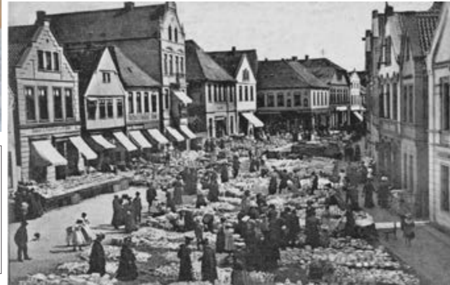
... vor etlichen Jahren in Verden an der Aller. Diese historische Ansichtskarte und weitere finden Sie auf der Homepage von Volker Wolters unter www.ansichtskarten-landkreis-verden.de