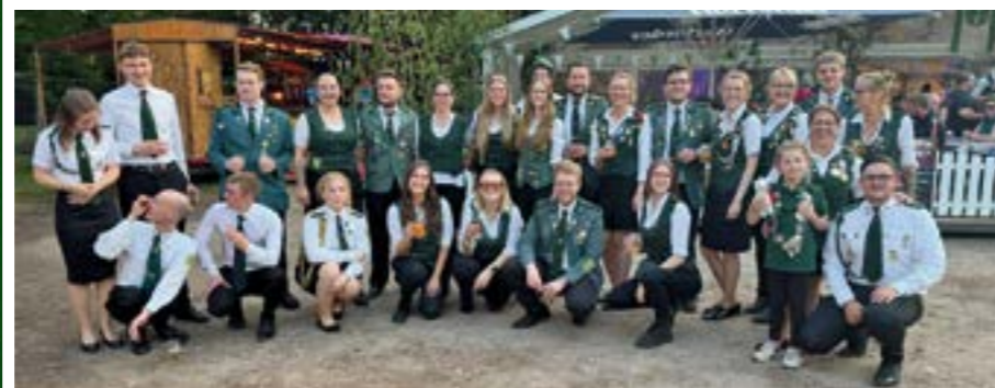
Die Schützenjugend freut sich auf das kommende Schützenfest ...

HASSEL. Ab Himmelfahrt geht es wieder rund in Hassel und es wird Schützenfest gefeiert – diesmal mit neuem Konzept: Die Schützenscheiben werden bereits am Samstag verteilt und direkt nach dem Ausbringen findet der Schützenball statt. Am Sonntag wird ein buntes Rahmenprogramm für die ganze Familie Gemeinde- und Preisscheibe. Auf dem Zeltplatz sorgt DJ Uwe Eggers ab 12 Uhr für musikalische Stimmung. Ab 14.30 Uhr wird mit Spannung die Proklamation des neuen Kaisers, Schützen- Jugend- und Kinderkönigs erwartet. Ab 18 Uhr steigt die Zeltparty mit dem TNT Team. Nach dem Ruhetag am Freitag beginnt das Fest am Samstag, den 16. Mai um 16.20 Uhr mit dem Antreten zum Ummarsch durch das Dorf zur Befestigung der Königsscheiben unter Begleitung des Spielmannzugs Rethem. Ab 20 Uhr findet der große Festball mit der Band „Happy End“ statt. Während des Abends erfolgt die Proklamation des Gemeindegö-