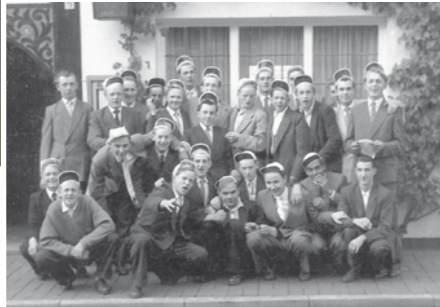
... nach Steinhude. Alle haben sich für den Ausflug fein rausgeputzt.