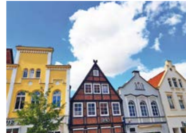
Verdener Fassaden ...

VERDEN. Verden lässt sich am besten bei einer Stadtführung entdecken. In der Norder- und auch Süderstadt finden sich historisch bedeutende Gebäude: der Dom mit dem steinernen Mann, die St. Andreas- und auch die Johanniskirche sowie das ehemalige Fischerviertel. Neben all dem Historischen findet sich aber auch Neues und Modernes. All dies liegt in Verden nah beieinander und lässt sich bequem zu Fuß erreichen. Nehmen Sie an einer öffentlichen Stadtführung teil, die an jedem Samstag des Monats um 15 Uhr rund um das Thema Verdener Stadtgeschichte bis Ende Oktober (außer Domweih-Samstag am 30. Mai) angeboten wird.