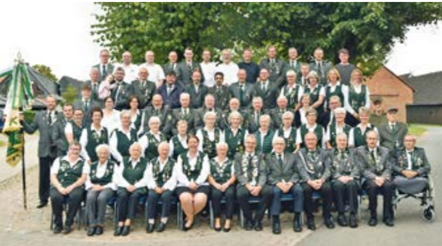
Mit großer Vorfreude blickt der Schützenverein Ahnebergen-Barnstedt auf das Festwochenende – und lädt alle herzlich ein, Teil dieses besonderen Jubiläums zu werden.

AHNEBERGEN/BARNSTEDT. Der Schützenverein Ahnebergen-Barnstedt blickt in diesem Jahr auf ein ganz besonderes Jubiläum: Seit 75 Jahren prägt der Verein das Dorfleben und die Gemeinschaft vor Ort. Dieses Ereignis soll an diesem Wochenende, sprich vom 8. bis 10. Mai gebührend gefeiert werden. Den Beginn macht am Freitag der „Ahneberger Abend“, ein geselliger Auftakt für alle Dorfbewohner sowie geladene Gäste aus befreundeten Nachbarvereinen. Ein abwechslungsreiches Programm mit Reden, humorvollen Einlagen in Form eines Sketches, einer Tombola sowie der Siegerehrung des Jubiläumssports sorgt für beste Unterhaltung, sodass einem geselligen Beisammensein nichts im Wege steht. Der Samstag steht ganz im Zeichen des großen Schützenfestes. Insgesamt acht Gastvereine werden erwartet. Neben der Pokalgemeinschaft Verdener Marsch – bestehend aus den Vereinen aus Hönisch, Döhlbergen-Rieda und Wahnebergen – nehmen anlässlich des Jubiläums auch die Vereine aus der Gemeinde Dörverden teil, namentlich Westen, Hülsen, Stedorf, Dörverden und Barme. Nach dem traditionellen Ummarsch, zum Wegbringen der neuen Majestäten, die bereits am 2. Mai ausgeschossen wurden, dürfen sich die Besucher auf Kaf-