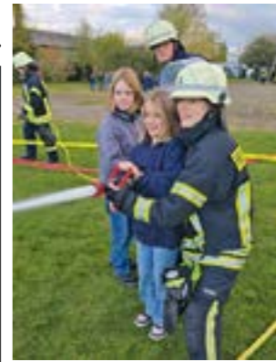
Die praktischen Übungen kamen gut an

HOYA. Die Kinderfeuerwehr Hoya durfte vor kurzem eine Nacht im Feuerwehrhaus verbringen. Nachdem alle ihre Betten aufgebaut hatten, erfolgte ein gemeinsames Abendessen mit Bratwurst und Pommes. Die Kinder und Betreuer nahmen dann am Abend bei dem aktiven Dienst der Feuerwehr Hoya teil. Alle Kinder durften mit dem Strahlrohr ein Feuer löschen, ein Atemschutzgerät aufsetzen, an einer Höhenrettung teilnehmen und sich in einer Schleifkorbtrage in die Höhe ziehen lassen und viele weitere spannende Sachen. Die Kinder waren begeistert. Als Dankeschön gab es für die Feuerwehrleute Bratwurst von der Kinderfeuerwehr. Nach einer ruhigen Nacht starteten alle mit einem gemeinsamen Frühstück. Zum Abschluss stand noch ein Besuch auf dem Spielplatz und bei der Ortsbrandmeisterin an, bevor alle Kinder von den Eltern abgeholt wurden.