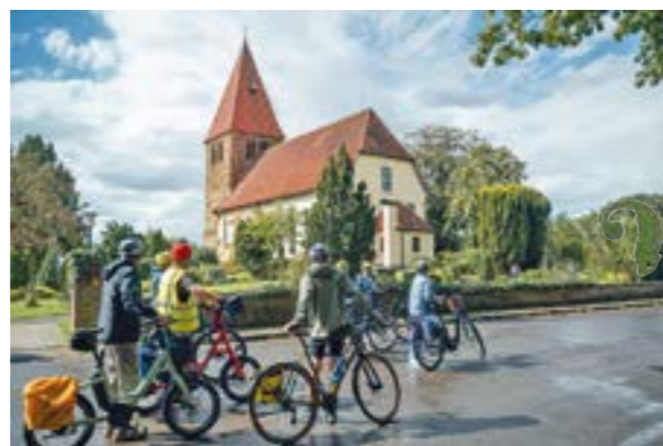
„Gemeinsam Meter sammeln!“ für die Samtgemeinde Grafschaft Hoya

In den Zeitraum des STADTRADELN fallen beispielsweise auch die mobile Gewerbeschau "Grafschaft Hoya ist mobil!" am Himmelfahrtstag (14. Mai) und die öffentliche Gästeführung „Mühlen-Radtour“ am Pfingstmontag (25. Mai). Weitere Infos unter der Telefonnummer (04251) 815 47 oder per E-Mail an tourismus@hoya-weser.de . STADTRADELN ist mehr als ein Wettbewerb. Es ist ein Gemeinschaftsprojekt. Also: Fahrrad checken, die Klasse, Freunde oder den Kollegenkreis motivieren und dabei sein!