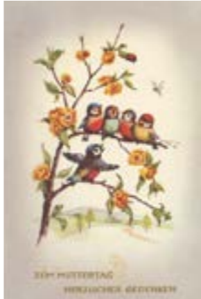
... vergangener Tage.