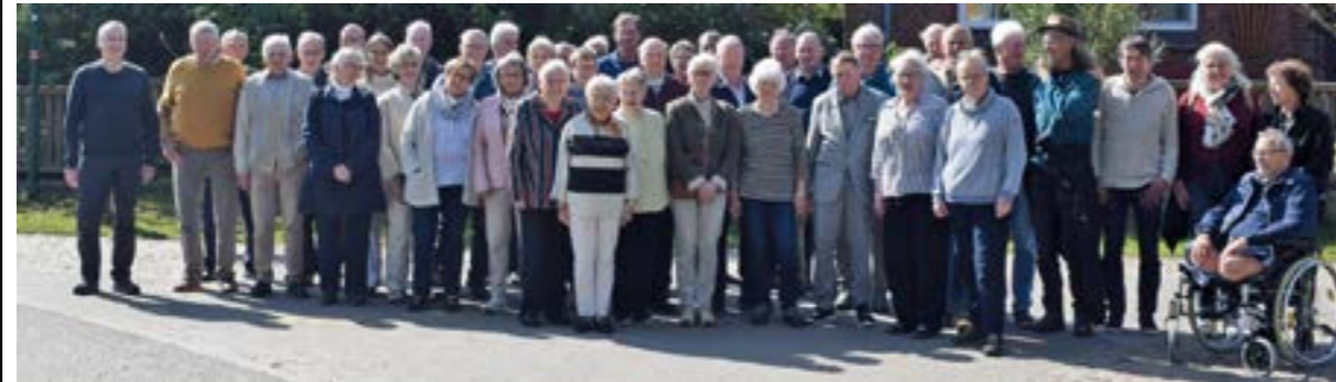
Die ehemaligen Schülerinnen und Schüler der Volksschule Ahnebergen

Schultreffen der ehemaligen Volksschüler in der Schützenhalle Ahnebergen