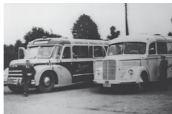
... 1948 wieder aufwärts ging mit sicheren Arbeitsplätzen und besseren Löhnen, fuhren die Urlauber gerne mit Omnibussen in Richtung „Bella Italia“ oder zu unseren Nachbarn nach Österreich. (R.Kl.)