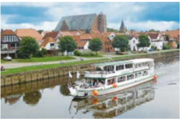
Die Flotte Mittelweser bietet auf dem Fahrgastschiff „Stadt Verden“ im April vielfältige Weserfahrten-

begehrt: Spargel satt, Schinkenplatte, Salzkartoffeln, Schnitzel, Rührei, Sauce Hollandaise und Buttersauce. Rückkehr wieder am Anleger ist um 14 Uhr. Das Fahrgastschiff „Stadt Verden“ bietet auch im April wieder die Aller-Weser-Rundfahrten und die Bremenfahrten an. Ideal für alle Werder Fans mit Tickets: Werder Bremen spielt am Samstag, 18. April um 15:30 Uhr im Derby gegen den Hamburger SV. Das Schiff wäre um ca. 13.30 Uhr am Anleger Weserstadion. Die Reederei bietet Fahrten ab dem Anleger Nienburg nur auf Anfrage an. Den Fahrplan, die Eventflyer mit den Schiffspartys und den Schlemmerfahrten gibt es bei der: Flotte Mittelweser GmbH & Co. KG, Forstweg 5, 31582 Nienburg, Telefon (05021) 919311, nienburg@flotte-weser.de, www.flotte-weser.de