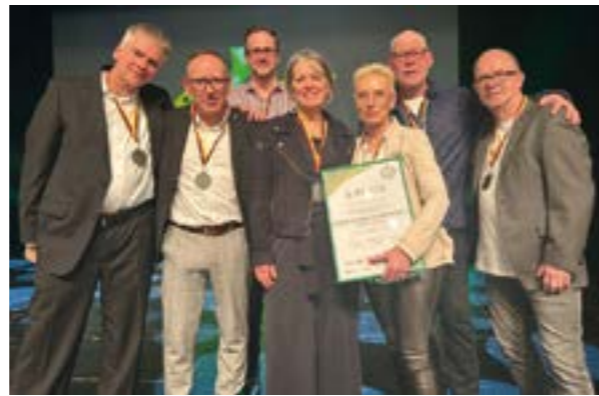
Das Team PingPongParkinson Eystrup wurde während einer Gala im Theater in Nienburg geehrt.

Termininfo: Vom 26. bis 30. September 2026 findet in Hannover die 7. PingPongParkinson Weltmeisterschaft statt. Info und Anmeldung unter pppwc.org!