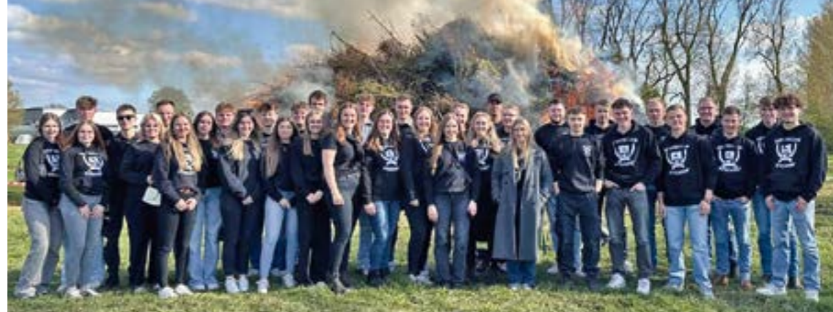
Der Erntecub Stedorf freut sich auf viele Gäste und einen stimmungsvollen, unvergesslichen Abend.