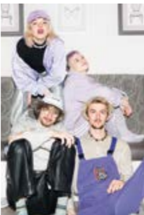
Die Band „munterfel.“ gastiert in der Kneipe Westen.

WESTEN. Am Samstag, den 11. April 2026 um 20 Uhr, Einlass ab 19.30 Uhr, tritt die Band „munterfel.“ in der Kneipe Westen, Hauptstraße 20 auf. „munterfel.“ ist die Übersetzung eines Gefühls in eine Band. Ein Fluchtpunkt von grauer Realität in eine bunte Parallelwelt. Die junge, geschlechterparitätische Pop Band based in Leipzig. Während sie mit ihrer Besetzung aus Gesang, Drums, Synthesizer