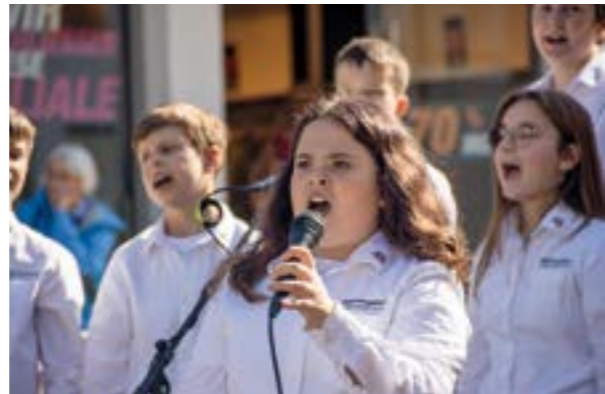
Auch in diesem Jahr bietet die Open Stage ein buntes Musikprogramm auf dem Rathausvorplatz auf offener Bühne