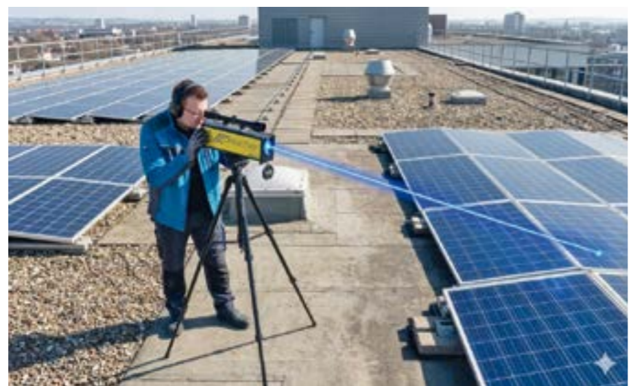
Die Fehlersuche in Bestandsanlagen mittels modernster Ortungstechnik gehört zum Leistungsangebot von Drescher.

„Kurz zusammengefasst machen wir seit 25 Jahren Elektrotechnik für Industrie und Gewerbe“, sagt Drescher. „Wir statten Industrie, Gewerbe und Produktionshallen mit kompletter Elektrotechnik aus – von der Energieverteilung über Beleuchtung bis hin zur Endinstallation inklusive Gebäudeautomation, Datentechnik und LWL-Verlegung mit Spleißarbeiten.“ Tatsächlich deckt das Unternehmen heute nahezu das