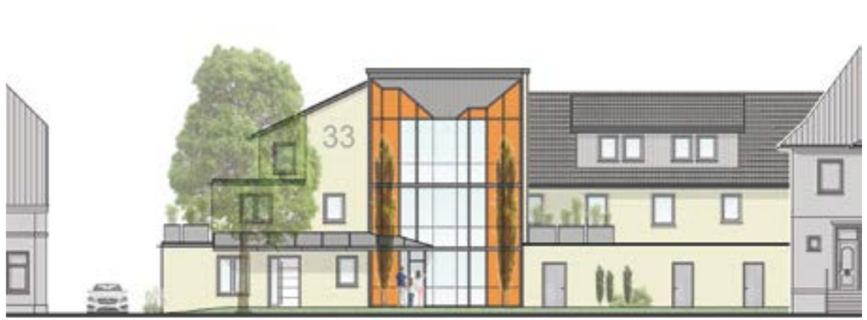
Das äußere Erscheinungsbild des Gebäudes in der „Von-Kronenfeldt-Straße 33“ wird sich künftig ebenfalls verändern.

HOYA. Die Sanierungsarbeiten im ehemaligen Ärztehaus in der „Von-Kronenfeldt-Straße 33“ verlaufen planmäßig und machen gute Fortschritte. Die Sanierungsarbeiten und Handwerkern umfassend kernsanieren. Es entstehen insgesamt 12 barrierefreie Mietwohnungen in unterschiedlichen Größen von 39 bis 96 Quadratmeter und eigenen KFZ-Einstellplätzen. Da das ehemalige Ärztehaus als solches nicht mehr genutzt wird, wurden sowohl im Außen- und Innenbereich