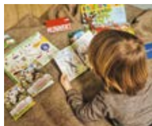
Diverse Materialien warten auf die „Lütten“

Materialien für Kitas und Tagespflegepersonen