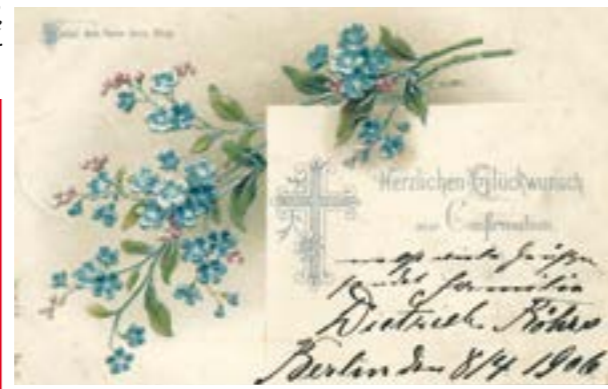
Die Karte wurde am 8. April 1906 aus Berlin verschickt.