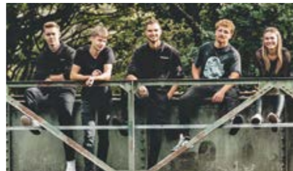
Auf der Weserbühne treten die lokalen Bands „The Rookies“ ...