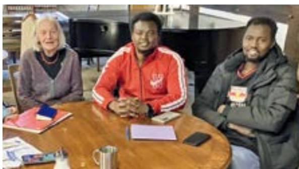
Beim Café International im Ehmken Hoff