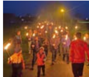
Das Osterfeuer wird traditionell von den Kindern mit einem Fackellauf entzündet.

HÄMELHAUSEN. Am 4. April lädt die Freiwillige Feuerwehr Hämelhausen zum Osterfeuer „Am Wiesengrund“ ab 18.30 Uhr ein. Für das leibliche Wohl mit Pizza, Grillwurst und Getränken ist gesorgt. Um 19.30 Uhr ist das Treffen zum Fackellauf an der Dorfstraße 81 in Hämelhausen. Die Termine für die Holzannahme sind am Samstag, 28. März 2026 von 9 Uhr bis 16 Uhr und am Ostersonntag, 4. April 2026 von 9 Uhr bis 12 Uhr. Die Veranstalter freuen sich über viele Gäste.