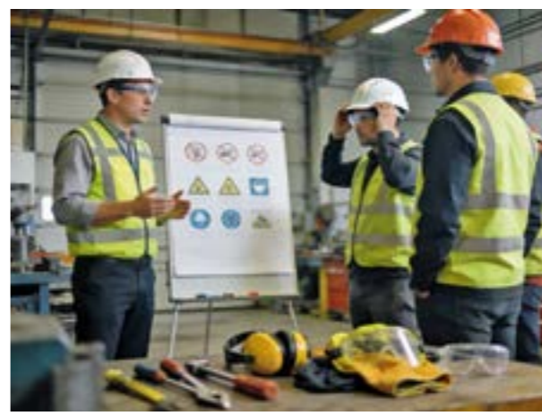
Arbeitssicherheit ist ein weiterer zentraler Zweig bei Drescher – angeboten werden zahlreiche Fachschulungen und Kurse.

Mit der Schwesterfirma Drescher Solar GmbH investiert die Unternehmensgruppe gezielt in den Ausbau erneuerbarer Energien. „Die Förderung nachhaltiger Technologien ist nicht nur Geschäftsmodell, sondern Überzeugung“, betont Markus Drescher. Das Portfolio im Bereich Photovoltaik (PV) ist umfassend. Angeboten werden PV-Klein- und Großanlagen für Industrie, Gewerbe und Privatkunden – von 1 Kilowattpeak (kWp) bis zu mehreren Hundert kWp im gewerblichen und industriellen Bereich. Neben Planung und Installation gehören auch Batteriespeichersysteme, Wallboxen für Elektrofahrzeuge und individuelle Netzanschlusskonzepte zum Leistungsspektrum. Neu im Angebot sind Batteriespeicher mit integriertem Löschesystem und Thermomanagement, die zusätzliche Sicherheitsstandards erfüllen. Auch die Fehlersuche in Bestandsanlagen mittels modernster Ortungstechnik zählt