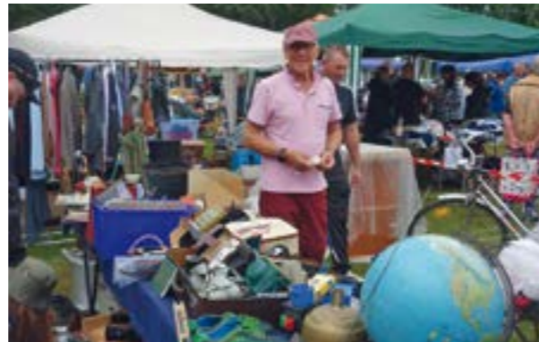
Am 1. Mai laden wieder zahlreiche Stände zum Stöbern ein.

Neben dem Flohmarkt wird den Gästen zudem ein buntes Rahmenprogramm geboten. Der ortsansässige Förderverein KiGruschu bietet wieder eine Tombola mit attraktiven Preisen und Kindersminken an. Für die Kleinsten steht auch wieder die Hüpfburg bereit. Kinder und Jugendliche können das Gefühl der Schwerelosigkeit auf dem Bungee Trampolin erleben. Wer schon immer mal traditionelles Bogenschießen ausprobieren wollte, hat an diesem Tag bei der Bogensportsparte des Sportvereins die Gelegenheit dazu.