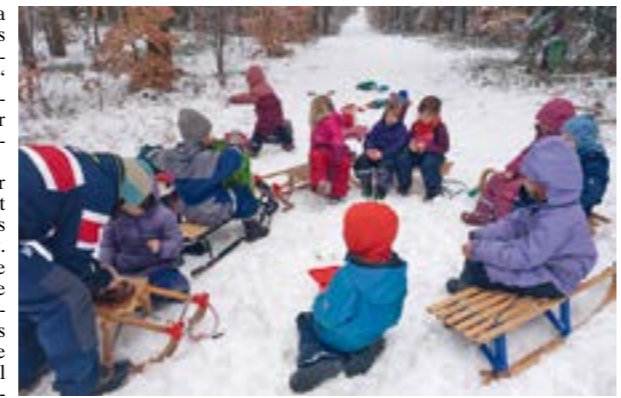
Frühstückspause des Waldkindergartens „Diensthoper Rudel“

DIENSTHOP. Endlich war er da – ein Winter, wie wir ihn uns gewünscht haben! Im Waldkindergarten „Diensthoper Rudel“ herrscht ausgelassene Begeisterung. Der schneereiche Winter verwandelt den Wald in ein echtes Abenteuerparadies. Mit roten Wangen wurde auf der Lichtung am Bauwagen mit Schnee gebaut, selbst gemachtes Eis gegessen, getobt und gelacht. Ein kleiner Hügel verwandelte sich schnell in eine fröhliche Rodelbahn. Auch an die fliegenden Freunde wurde gedacht – das energiereiche selbstgemachte Vogelfutter war immer so schnell aufgepickt, dass oft für Nachschub gesorgt werden musste. Neben all dem Spaß wird der Winterwald aber auch genau unter die Lupe genommen. Mit detektivischem Spürsinn beugen sich die Kinder über geheimnisvolle Abdrücke im Schnee - beim Lesen von Tierspuren wird spekuliert, kombiniert und gestaunt. Der Wald wird zum lebendigen Bilderbuch, jede Spur erzählt eine Geschichte. Und wenn Finger und Nasen kalt werden, wärmt sich das Rudel im gemütlichen und warmen Bauwagen bei Tee und fröhlichem Erzählen wieder auf. Fazit: Winter im Wald ist kein Grund zum Frieren – sondern zum Feiern! Der Waldkindergarten „Diensthoper Rudel“