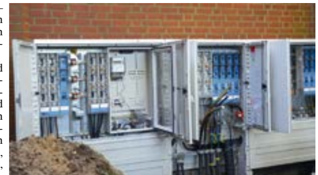
Von der Energieverteilung bis zur smarten Gebäudeautomation realisiert Drescher moderne Elektroinstallationen für Industrie und Gewerbe.

Mehr Informationen sind im Internet unter der Adresse www.drescher-automatisierung.de abrufbar. Erreichbar ist die Drescher-Automatisierung GmbH an der Hoyaer Straße montags bis freitags von 7 bis 16 Uhr unter der Telefonnummer 04251/671342 oder per E-Mail an info@drescher-automatisierung.de .