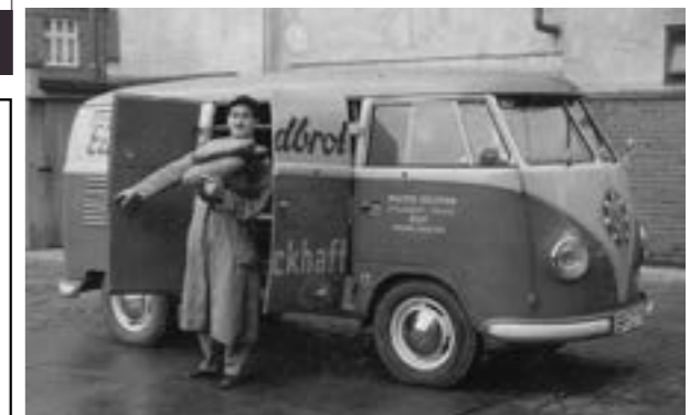
... aus Eitzendorf beim Ausliefern von Backwaren.