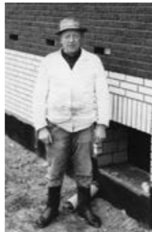
... Maurermeister aus Helzen-dorf vor 65 Jahren.