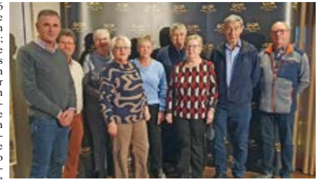
Der Kegelclub „Schlappe 9“ im GOP.

DÖRVERDEN. Anfang 1986 ließen sie zum ersten Mal die Kugeln auf der Kegelbahn im Gasthaus Schindowski rollen; jetzt konnten sie das 40-jährige Bestehen ihres Kegelclubs „Schlappe 9“ feiern. Aus diesem Anlass besuchten die Mitglieder das GOP in Bremen und konnten dort nach einem ausgiebigen Buffet eine äußerst unterhaltsame Vorstellung genießen. Auch wenn inzwischen mangels geeigneter Kegelbahnen eher eine ruhige Kugel geschoben wird, so trifft man sich doch weiterhin einmal im Monat im privaten Kreise sowie zum gemeinsamen Kohl-, Spargel- und Weihnachtsessen. Zu den Aktivitäten des Kegelclubs gehören auch regelmäßige jährliche Ausflugsfahrten