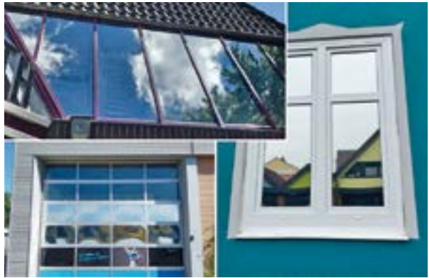
Professionelle Sonnenschutz- und Sichtschutzfolien sowie deren Anbringung bietet einfallsgest

Mit dieser Erweiterung untermauert einfallsgest seinen Anspruch als ganzheitlicher Partner für visuelle Kommunikation. Kunden erhalten somit alles aus einer Hand – vom gebrandeten Firmenwagen, über das vollständige Corporate Design und Werbeschilder, bis hin zur funktionalen Aufwertung ihrer Immobilien.