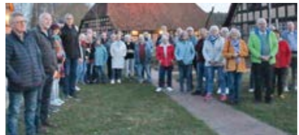
Viele Vereinsmitglieder haben die Ehrung begleitet

Den Tag seines offiziellen Abschieds wird er sicherlich nicht so schnell vergessen, da ihm seitens der Anwesenden aufrichtiger Dank und Wertschätzung entgegengebracht wurde. Er selbst fasste sich kurz und bedankte sich mit einer Liedzeile aus einem Song des Sängers Joris: „Das Herz sagt bleib, der Kopf sagt geh.“