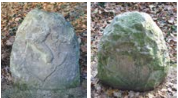
Schnedenstein im Grenzgraben Klein Häuslingen/Schwarzer Weg. Die beiden Seiten des Steins zeigen den Lüneburger Löwen (links) und das Verdener Kreuz.

HÄUSLINGEN. Zwischen dem Bereich Häuslingen/Rethem und Verden lässt sich eine Grenzziehung über 1000 Jahre zurückverfolgen. Um 1000 grenzten hier im Herzogtum Sachsen das Loingau (Rethem) und das Sturmigau (Verden) aneinander. 1235 war es dann die Grenze zwischen dem Bistum Verden und dem Fürstentum Lüneburg. 1576 ließ Bischof Eberhard von Holle mehrere Schnedensteine (Schnede = Grenze) zwischen dem Bistum Verden und dem Fürstentum Lüneburg setzen, „damit fernhin keine Fehde mehr zwischen ihnen sei“. Nach dem 30-jährigen Krieg verlief hier die Grenze zwischen Schweden (Verden war von 1648 bis 1719 schwedisch und wurde 1719 friedlich von Stockholm an Hannover abgetreten) und dem Fürstentum Lüneburg. 1810 (französische Besatzungszeit) trafen an dieser Grenze das Kaiserreich Frankreich (Häuslingen) und das Königreich Westfalen (Verden) zusammen. Nach den Befreiungskriegen war hier im Königreich Hannover die Grenze zwischen den Landdrosteien Lüneburg und Stade. Heute grenzen hier die Landkreise Heidekreis (Häuslingen) und Verden (Kirchlinteln) aneinander.