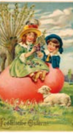
Postkarte vergangener Tage.

sitten laaten, wat wolln ji Froenslüd woll maaken, wenn wi Kirls da nich wörn, en halbet Jahr künnen ji up joue Eier sitten un kreegen da doch nix bi ruut! Tschilp-Tschilp-Tschilp!“ Einsender Helmut Thies