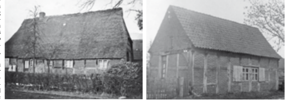
Alte Reihe Nr. 44 um 1910. Das Gebäude wurde zwischen 1953 - 1953 abgerissen.