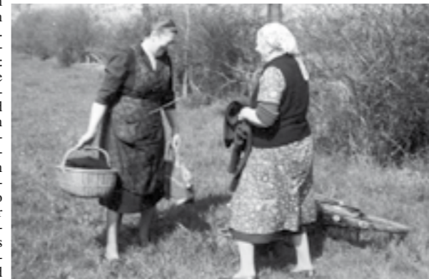
... beim Kümmelkohlsuchen um 1950 in Hassel. Kümmelkohl (auch als Wiesenkümmel bekannt) wuchs auf bestimmten Weiden und wurde wie Grünkohl gekocht.