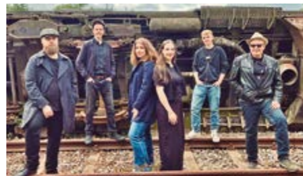
... und „Lost Phantomzzz“ am 19. April 2026 auf.

HOYA. Die Fördergemeinschaft Das neue Konzept bringt frischen Wind in die traditionsreiche Veranstaltung. Neben den innovativen Veranstaltungskonzepten in den Weserfrühling 2026 – und das mit beeindruckender Resonanz: Rund 40 Standbetreiber haben sich bereits angemeldet. Damit zeichnet sich für die Veranstaltung, die am Sonntag, 19. April 2026, in der Innenstadt von Hoya stattfindet, schon jetzt ein Rekord an Teilnehmern ab.