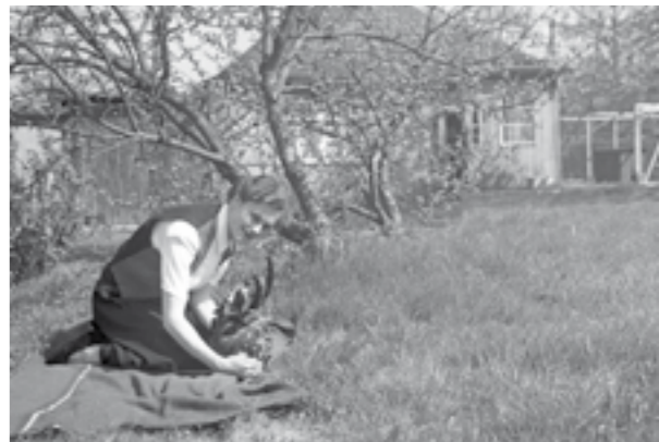
... mit einem Chabo Hahn im Garten in Bücken am Hestern 4.