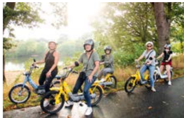
Mitarbeitende fahren jeden Montag auf historischen Mofas der 70er-Jahre. Weitere Infos unter www.mofa-helden.de

Regional, authentisch, unvergesslich Mofa-Helden ist kein Konzern und kein Franchise aus der Großstadt. Es ist ein Herzensprojekt aus der Mitte Niedersachsens, das inzwischen Besucherinnen und